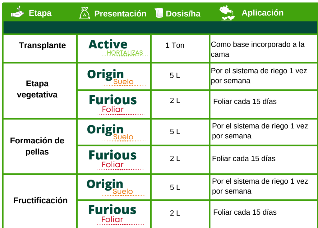
Tabla de aplicación para cultivo de coles